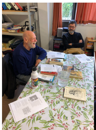
Photo's from the August Colazione