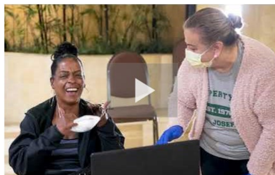
YouTube: Proyecto Roomkey en acción

El PRK sirve como ejemplo de lo que se puede lograr cuando las agencias gubernamentales, las comunidades, las tribus y otras organizaciones, se unen con urgencia y con un propósito compartido . Trabajando juntos, estos grupos llegaron a personas vulnerables y sin vivienda rápidamente, conectándolas con servicios y recursos significativos para mantenerlas seguras y alojadas.